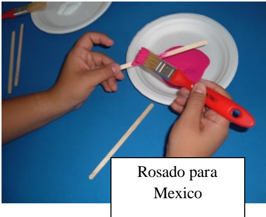
Rosado para México

- Pinta los palitos de helado de Blanco para Guatemala y Rosado para México. Déjalos secar.