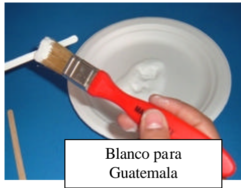
Blanco para Guatemala